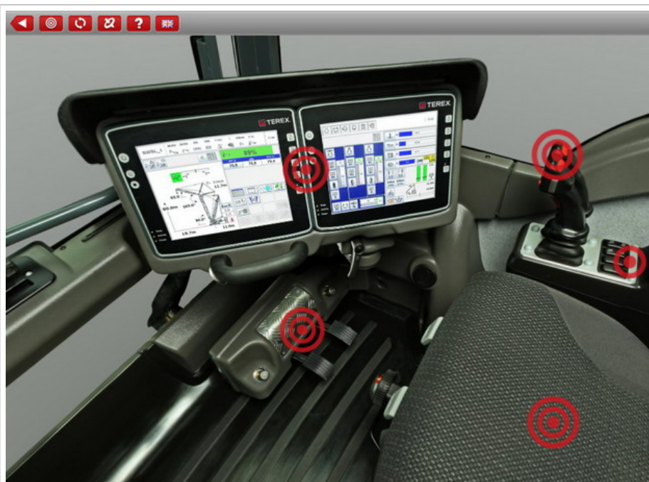
360° Innenraum Kabinenpanorama mit Hotspots

Hotspots sind Markierungen auf dem Bild, die angeklickt werden können und zu weiteren Informationen führen.