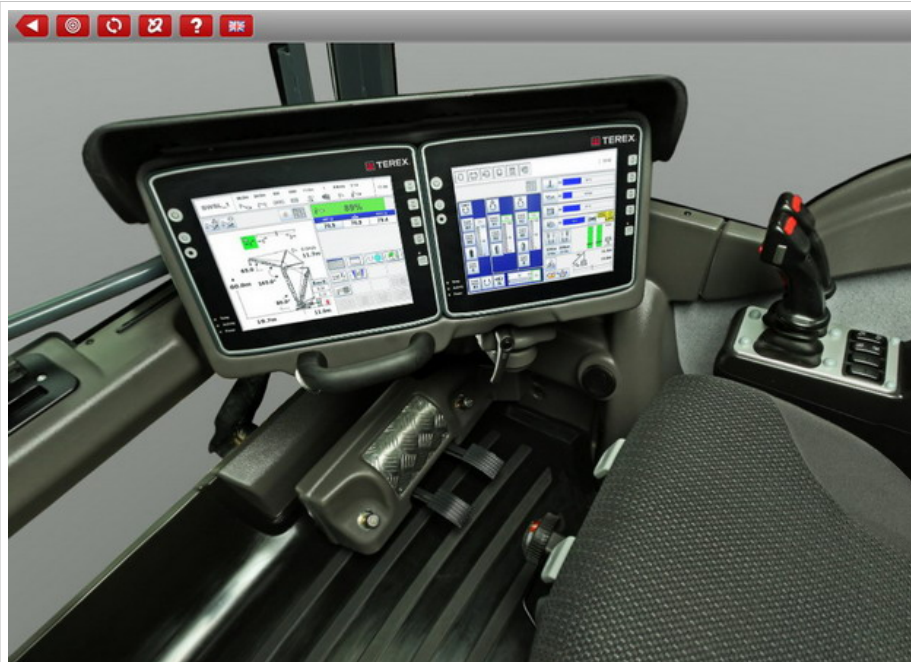
360° Innenraum Kabinenpanorama

Diese interaktive Sicht auf Ihr Produkt bietet einige Vorteile, insbesondere wenn: