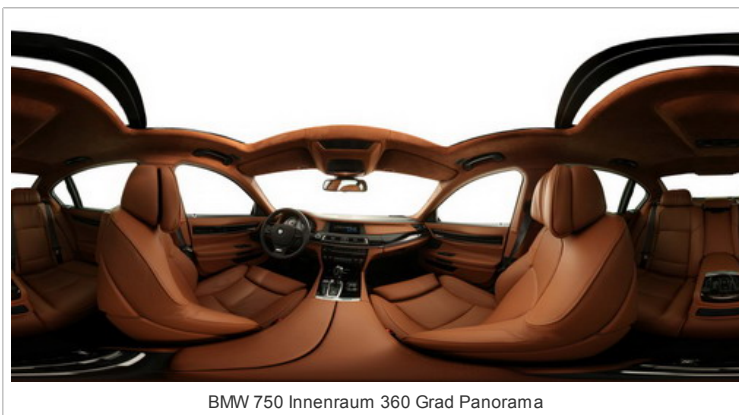
BMW 750 Innenraum 360 Grad Panorama

Das so entstandene Bild sieht im ersten Bearbeitungsschritt noch deutlich verzerrt aus: